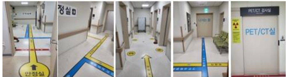
<PET/CT실 안정실 안내 바닥 유도선 및 번호 안내문 제작>