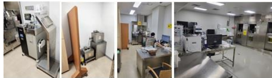
< PET/CT 주사실 내 차폐체 추가 설치, 의약품생산실 재배치 >