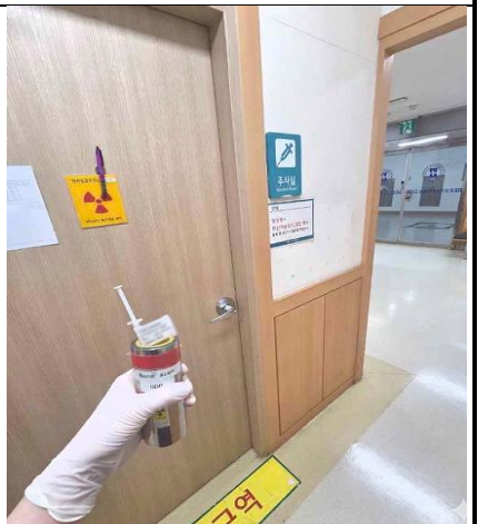
6.주사실에 방사성의약품 전달