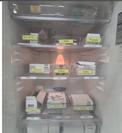
1.냉장고 약품 보관 / 의약품명 라벨링