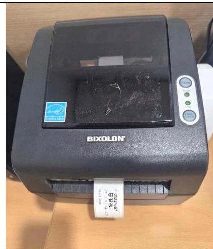
3.라벨 프린터에서 환자 정보 출력