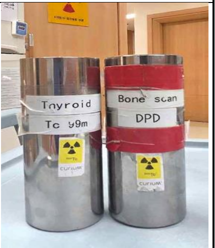
4.주사기 차폐 홀더에 사용 의약품 표시